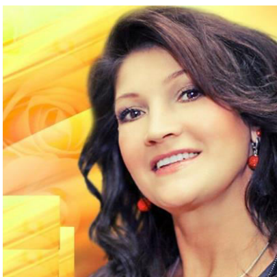
Певица, автор-исполнитель (г.Москва) Лауреат премии "Шансон года" в Кремле